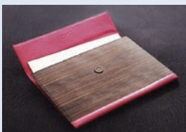
VEGATWOOD ブランドのバッグ

VEGATWOOD は日本の伝統文化・技術と天然木の魅力を新素材で表現し、発信するファッションブランドです。