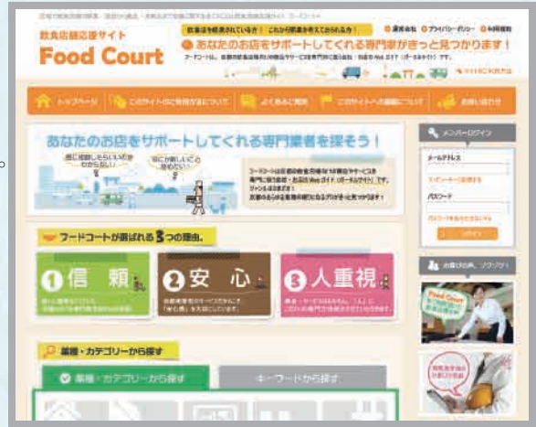
飲食店舗応援サイト『Food Court』のトップ画面

その一方で、水まわりのみならず飲食店のトータルサポートを目指して飲食店舗応援サイト『フードコート』の構築を目指して頑張っておられます。これは、飲食店のオーナー様や従業員の方から「こんなのはどこに売っているの?」とか「これは誰に頼めばいいの?」というお話をよく聞いてきた経験から、飲食店舗に直接提供できる商品やサービスを持っている専門業者と飲食店をマッチングするための仕組みが必要だと考え、飲食店舗応援サイト「フードコート『Food Court』」というポータルサイトの開設を考えられました。オーナー様や従業員の方が自分たちのお店を、自分たちの思い描いたお店にするために、自分たちの感性に合った業者を手軽に探し出せるポータルサイトの構築を目指しておられます。