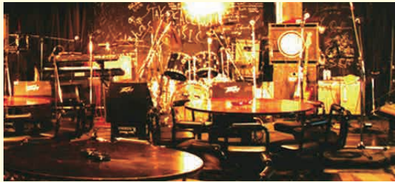
ライブスポットラグの店内

今回は一流ミュージシャンから地元のアマチュアバンドまで、連日多彩な音楽が楽しめる関西を代表するライブハウス「ライブスポット ラグ(LIVE SPOT RAG)」で有名なラグインターナショナルミュージックさんにお邪魔しました。