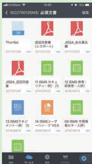
フォルダー内のファイル表示