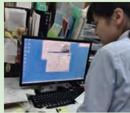
システム入力風景