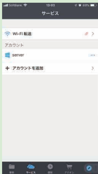
サーバーへの接続画面

SSATとは、スマートフォン、サービス、アプリ、タブレットの頭文字で、それらに関するワンポイント情報をお伝えしていくコーナーです。