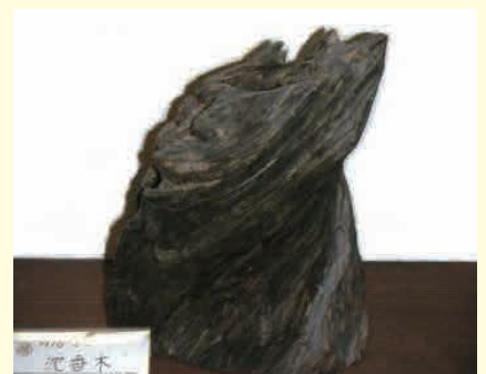
沈香木(東京鳩居堂銀座店展示品) 740グラムで27万1,950円也。 (Yahoo ジオンティーズから)

豚骨ラーメンよりも良い香りなんかな・・・ あかん、まだまだ「香Q」は花より団子です・・・失礼しました・・・(^^)