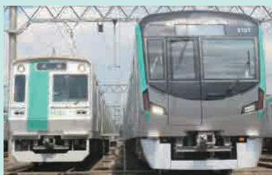
既存車両10系と新型車両

先月号で阪急電車初の冷房車5300系がまだ現役で走っており、電車の寿命って長いんですねと書きましたが、京都市の地下鉄に開業以来初の新型車両が登場することになりました。