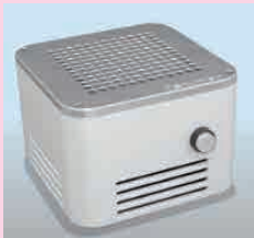
家庭のキッチン周りでも使える小型のシューマン