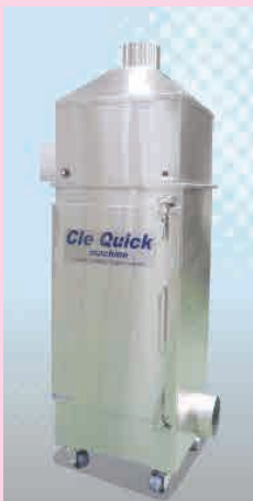
工場に設置する大型の工業用脱臭装置