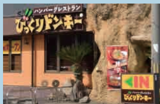
びっくりドンキー伏見店 西側に(株)元廣本社がある