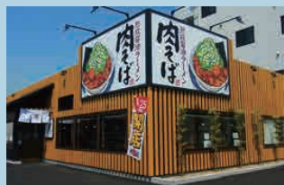
丸源ラーメン京都南イター店