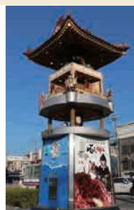
浜田駅前「どんちっち神楽時計」

また、木工技術を活かして作ってこられた“からくり時計”は全国各地で稼働しており同社の技術力を示しています。